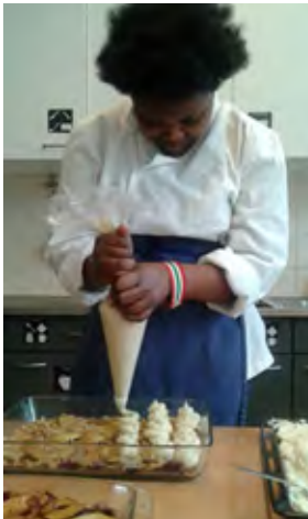
Pommes duchesse spuiten